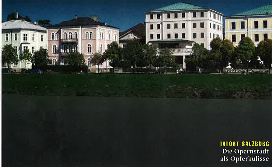
TATORT SALZBURG Die Opernstadt als Opferkulisse

Werner Kogler, Spitzenpolitiker der Grünen